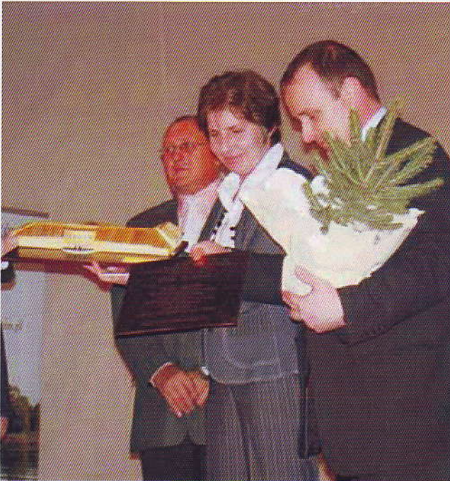
Statuetkę odbierają Wójt Gminy Bojanów i Dyrektor PSP w Przyszowie-Zapuściu