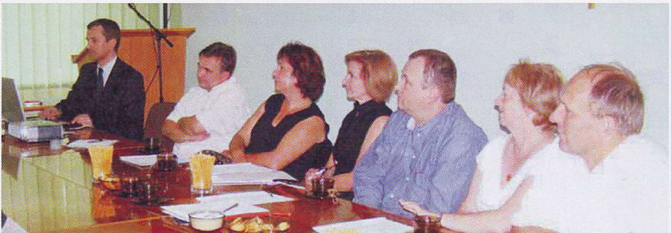
Posiedzenie Kapituły Konkursu